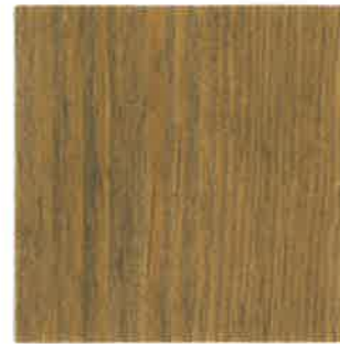
BA06 - Chaume