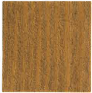
BA05 - Marmotte