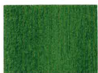
BD16 - Bouteille