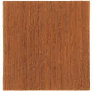
BA04 - Caramel