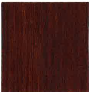
BN15 - Acajou