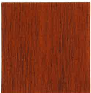
BN14 - Teck doré