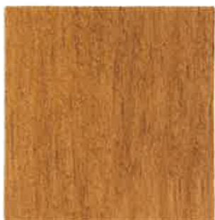
BN09 - Orme