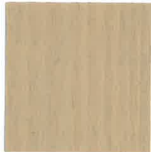
BA10 - Nivé