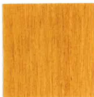
BN03 - Chêne doré