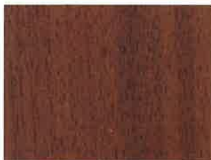
Bois à rénover