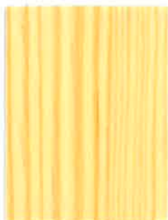
BOISÉA MAT ÉVOLUTION INCOLORE