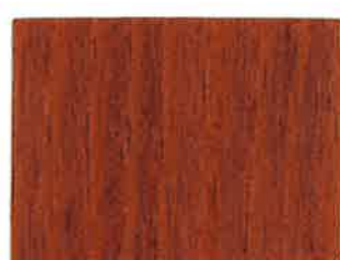
BD08 - Brun rouge