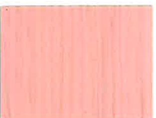
BD17 - Dragée