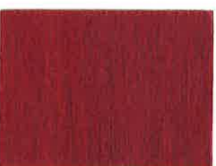
BD19 - Prune