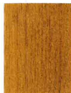
BOISÉA SATIN ÉVOLUTION CHÊNE CLAIR