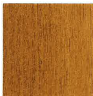
BN07 - Chêne clair