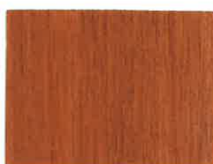
BD07 - Argile