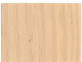
BD05 - Poudre