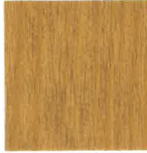
BA01 - Paille