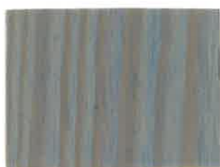
BD02 - Perle