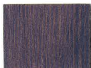
BD20 - Campanule