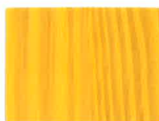
BD04 - Soleil