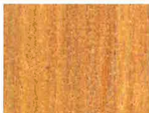
2 ème couche BOISÉA Chêne Clair