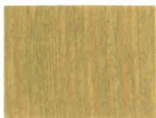
BD01 - Grège