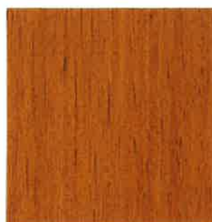
BN04 - Châtaignier