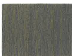
BD03 - Plomb