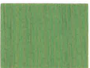
BD14 - Saugé