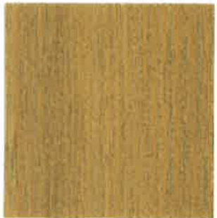
BA09 - Lichen