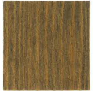
BA02 - Chamois