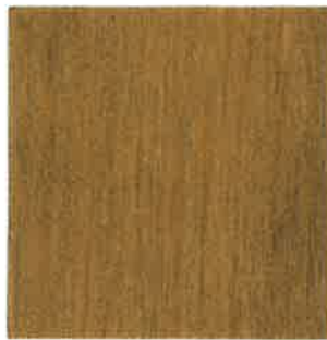
BA07 - Cairn