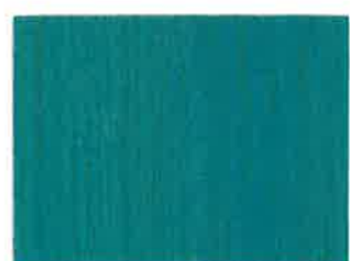
BD12 - Lagon