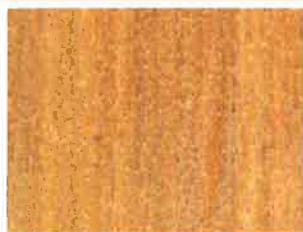
2 ème couche BOISÉA Chêne Clair