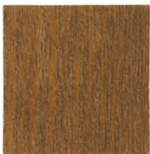
BN05 - Ipé