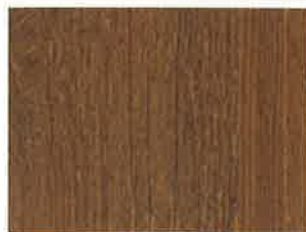
1 ère couche BOISÉA EQUALISEUR Oxyde Jaune