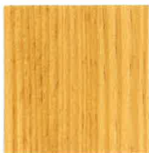
BN02 - Frêne