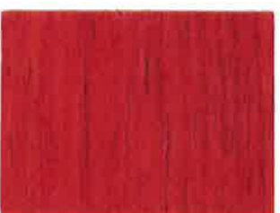
BD18 - Griotte