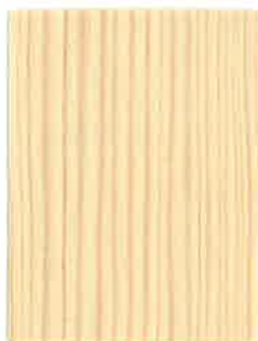
BOISÉA HYDROTEC INCOLORE