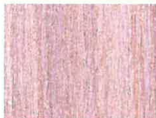
1 ère couche BOISÉA EQUALISEUR Blanc