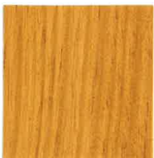
BN06 - Pin Nordique