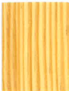
BOISÉA SATIN ÉVOLUTION INCOLORE