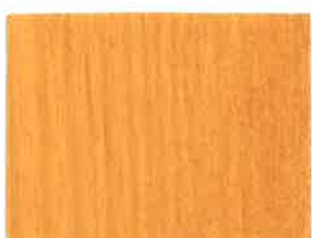
BD06 - Abricot