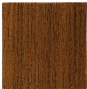
BN10 - Noyer