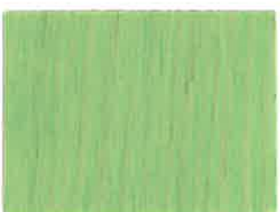
BD13 - Pistache