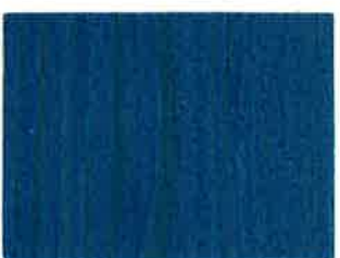
BD11 - Saphir