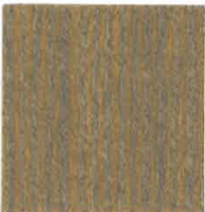
BA11 - Glacier