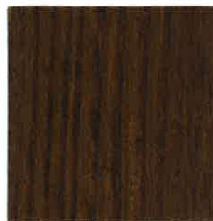
BN12 - Wengé