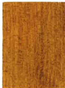
BOISÉA MAT ÉVOLUTION CHÊNE CLAIR