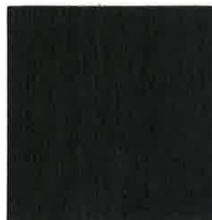
BN16 - Ébène