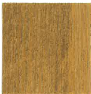
BN01 - Bambou