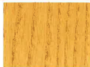
3 ème couche BOISÉA Chêne Clair

Toutes les teintes de ce nuancier ont été appliquées en 2 couches sur bois brut blanc. La teinte pourra varier en fonction du bois d'origine, du nombre de couches et/ou de l'épaisseur appliquée. Toujours faire un essai préalable sur des chutes de la même essence de bois et réaliser une surface témoin afin d'apprécier la teinte finale.