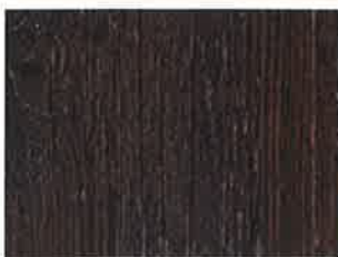
Bois à rénover