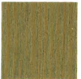
BA12 - Foin