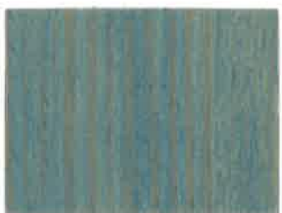
BD09 - Orage