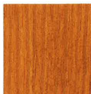
BN08 - Pin d'Amérique