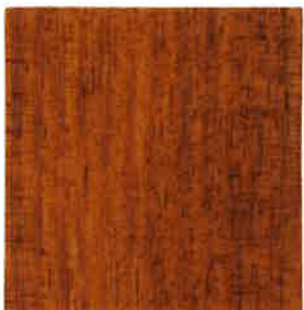
BN13 - Merisier