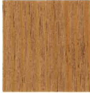
BA03 - Corde