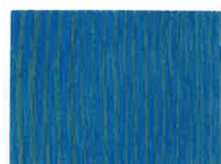
BD10 - Turquoise