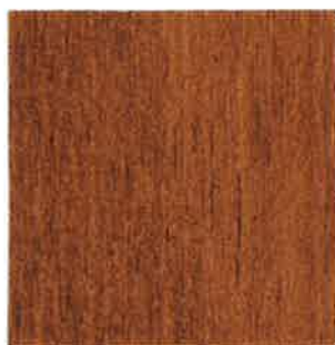
BN11 - Chêne foncé