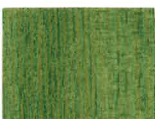
BD15 - Cèdre