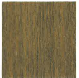
BA08 - Lauze